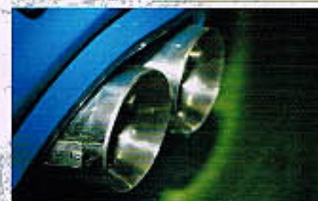
BSMAオリジナルの、4本用フルステンレス・エキゾーストシステム「BM-1 EXHAUST SYSTEM」を搭載。排気音調整時に適合しているため、車体にも対応している。

ホイールは「Carroll Shelby Wheels」のモデル名「CSI 20」をメイン。フルボーンメタリックカラーで、サイズは20インチ。また、オプションのブレンド・ブレーキシステムも選べる。