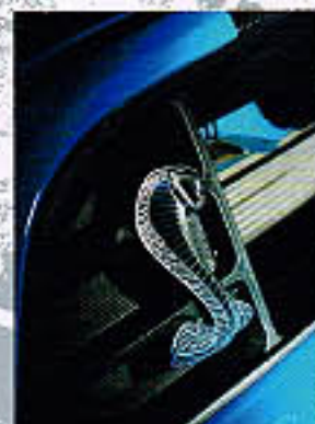
GT500仕様のグリルには、シェルビーのV8とV6のロゴのエンブレムが裏面に備わっている。

グラブ、20インチホイール、電動格納リアミラー、日本仕様LEDテールランプに交換された装着したパッケージを指す。これ以上を求めるユーザーには、ブレンド・ブレーキシステムやシカゴスピンホイールのトーン・スーパーチャージャー、排気調節式カスベンション(エアロゴスタ)、コンピュータ制御・プログラミンクといった数々のメニューを用意。まさにマスタングのチューナーとして検閲してくれるのがバズファクトリーであり「BSMA」なのだ。 「いつの時代もマスタングの『強さ』を誇示し続ける存在を『コブラ』のエンブレム。それは今もって健在である。」